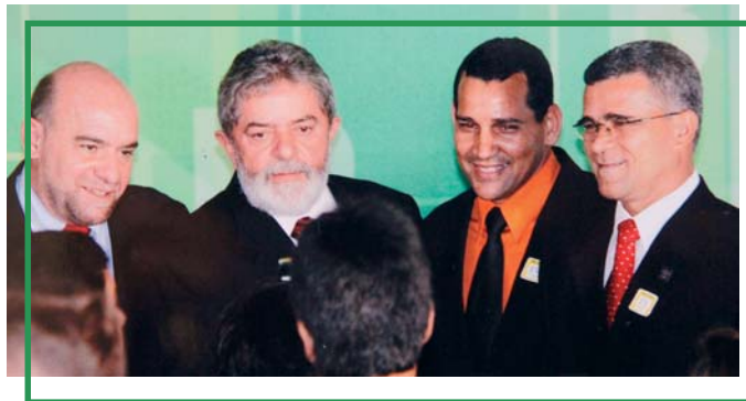
O Chefe da Nação ladeado pelo Presidente da Casa da Moeda, Diretor Técnico e Empregado, após o lançamento