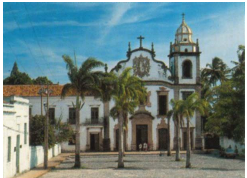
Basilica de São Bento, vista da janela do Arquivo Municipal de Olinda