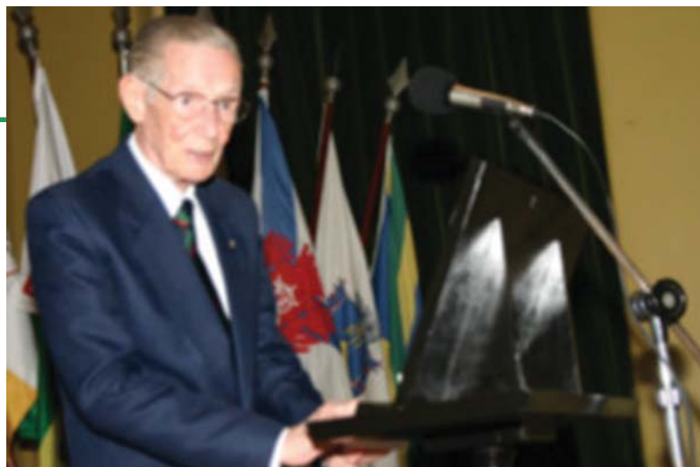
General Heraldo Tavares Alves em nosso moderno auditório

O Desembargador Liborni Siqueira foi um dos visitantes ilustres ao Arquivo Nacional, e declarou-se empolgado com a obra realizada pelos artesões na restauração do velho prédio onde funcionou durante mais de 100 anos a Casa da Moeda do Brasil. Sua excelência conheceu o moderno auditório, salão nobre e pátio onde são realizados os grandes eventos culturais, além dos setores de Consulta e Pesquisa, acompanhado por diretores da ACAN. O Desembargador, que também dirige conceituada organização de ensino e educação de jovens, estimou a possibilidade de promover uma visita de seus alunos à sede nova do arquivo e desfrutar da oportunidade para estudos e atualização.