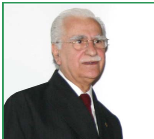
Desembargador Liborni Siqueira