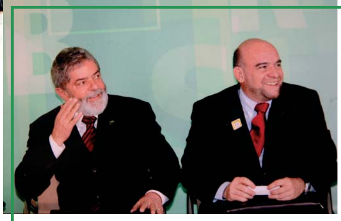
O Presidente Lula considerou o novo documento como um avanço tecnológico desenvolvido pela Casa da Moeda

Mais uma vez a Casa da Moeda trabalhando com dedicação a serviço do Brasil.